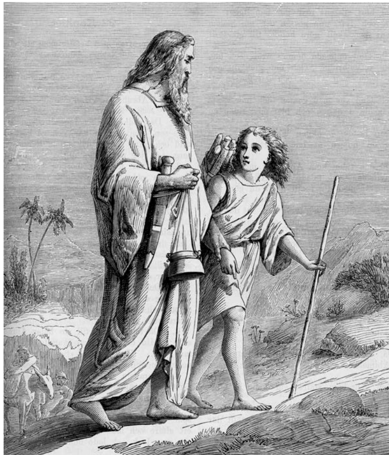
Abraham, en av de riktigt stora gestalterna i bibelreligionerna.

Efter det återvände de hem. Men ingen brydde sig om, hur Isak mådde efter den här grymma behandlingen. Hur kan man göra så mot ett litet barn? Detta är ren och skär sadism! Och Abraham själv? Hur kan en far, som älskar sitt barn, utsätta det för sådana vidrigheter utan att protestera det allra minsta?